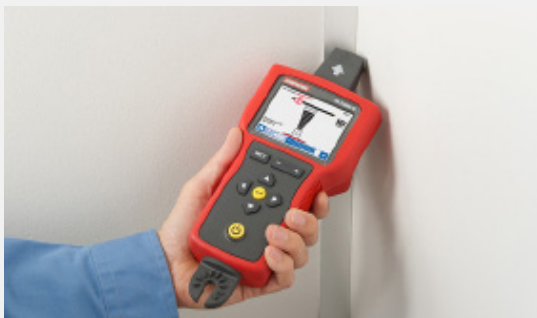
Verwenden der Sensorspitze zum Auffinden von Leitungen in schwer zugänglichen Bereichen.