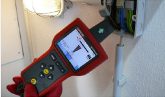
Auffinden spannungsführender oder spannungsfreier Leitungen durch Abnehmen der Verteilerkastenabdeckung.