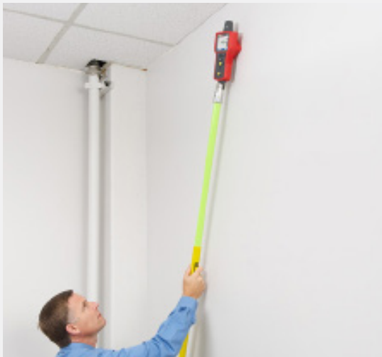
Aufspüren von Leitungen in schwer zugänglichen Bereichen mithilfe eines isolierten Verlängerungsstabs.