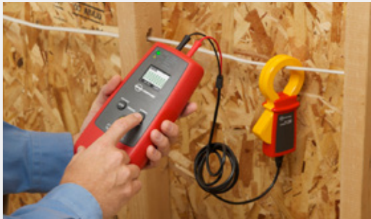
Induzieren des Signals mit der Stromzange, wenn nur isolierte Leiter vorhanden sind.