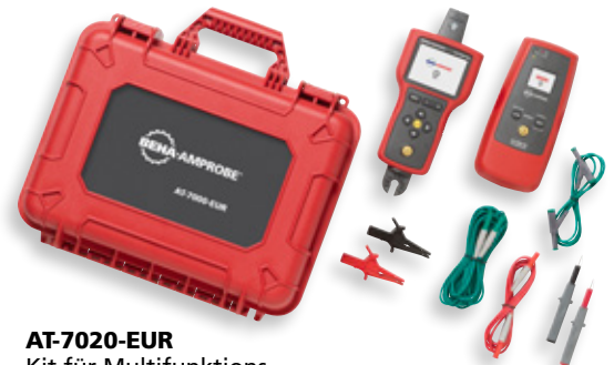
AT-7020-EUR Kit für Multifunktions- Leitungssucher