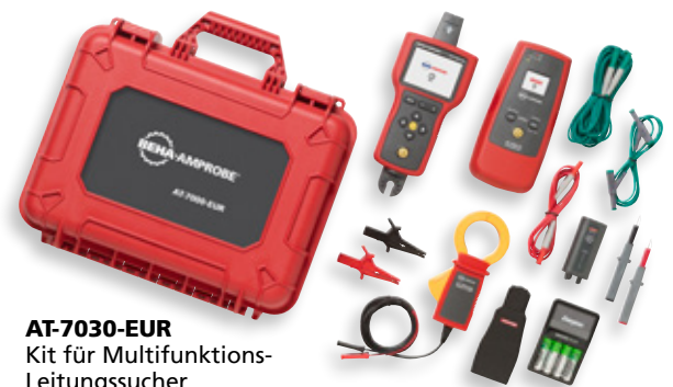
AT-7030-EUR Kit für Multifunktions- Leitungssucher